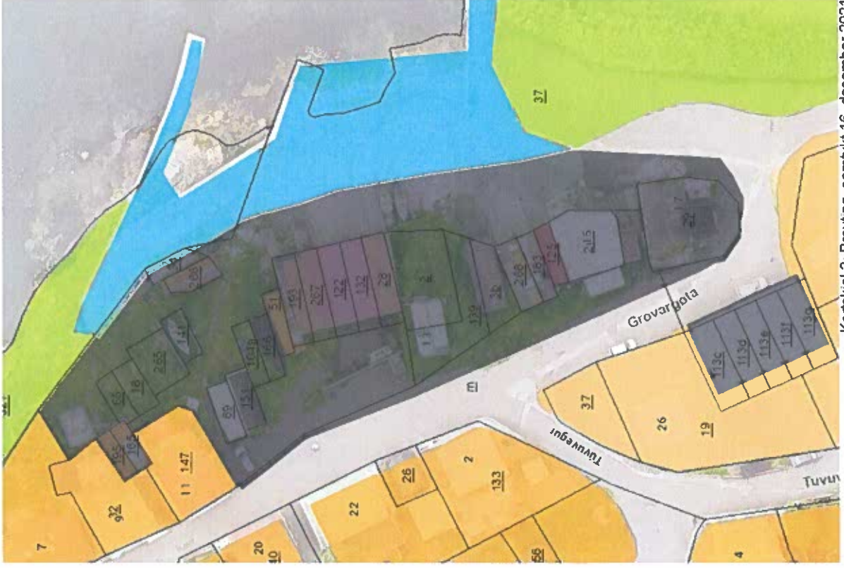
Kortskjal 2: Broying, samtykt 16. desember 2021